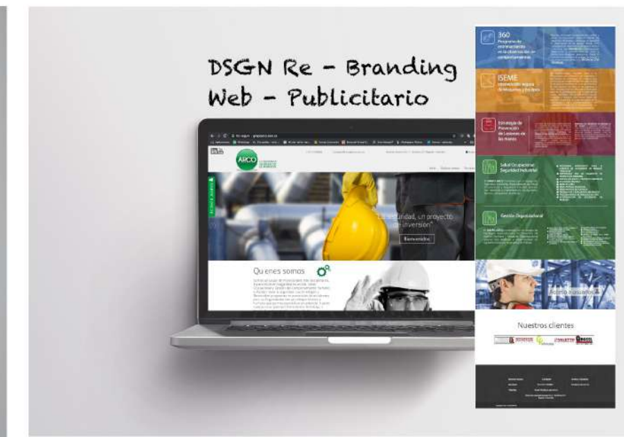
DSGN Re - Branding Web - Publicitario