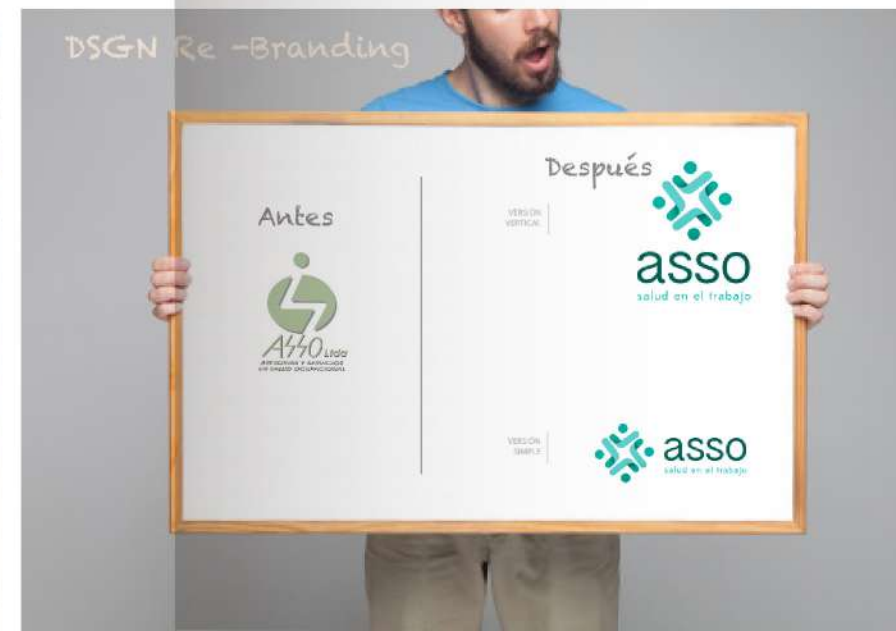
DSGN Re -Branding