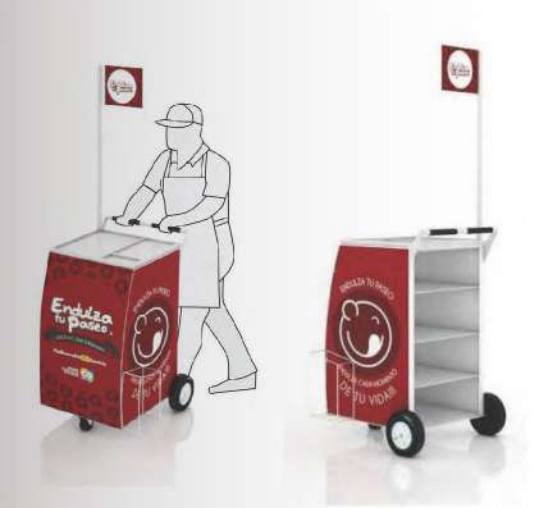
Estrategias de MKT