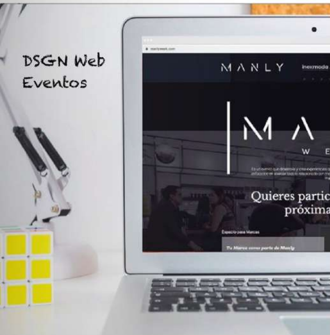
DSGN Web Eventos

“Tus ideas como un Lulo” * Wework Calle 93 . Of. 8123 * Redes @Lulodsgn * Whatsapp: 3112952256 *