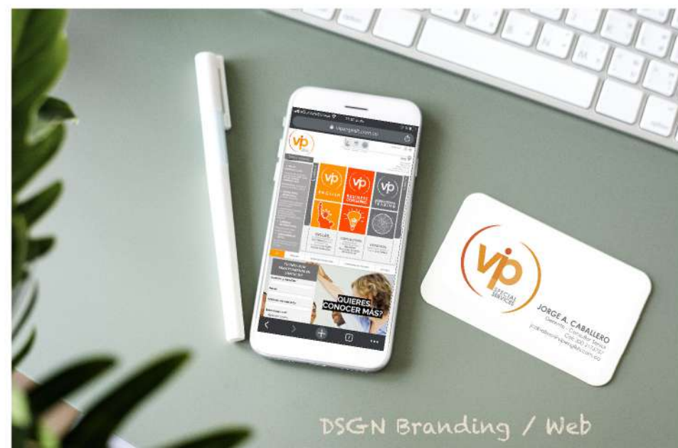
DSGN Branding / Web